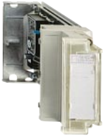
TSX ASZ 401