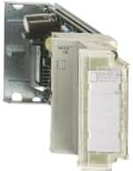
TSX ASZ 200