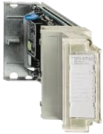
TSX AEZ 802